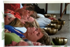
Sound message given to parents

The brain can better relate to the words if they are conveyed in a melodic way.